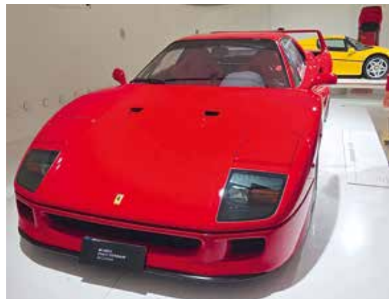
▲ Ferrari F40 – zu bewundern im Museo Enzo Ferrari in Modena, gelegen am ursprünglichen Werksgelände