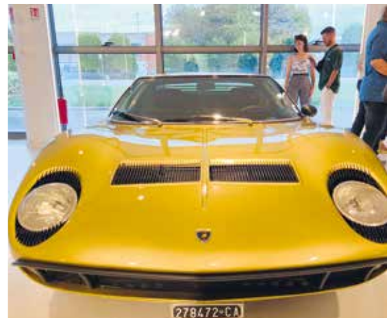
▲ Lamborghini Miura – für viele das schönste Auto der Welt (bei diesem Wimpernaufschlag ... )

Lassen wir einmal die Nebengeräusche, reden wir davon, warum wir eigentlich hier waren – Fahrzeuge, die die Welt be-