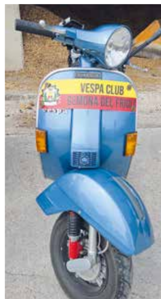
▲ Vespa PX