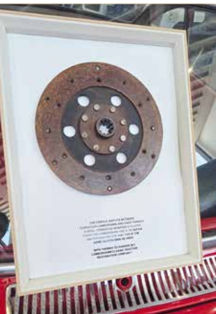
▲ Die Legende um die Kuppelung, der Anstoß für Ferruccio Lamborghini, ein besseres Auto als Ferrari zu bauen

geistern und immer wieder faszinieren. Ducati, Ferrari, Lamborghini, Maserati und andere „Italiener“ sind mehr als ein Aufreger in der Motorwelt, sie sind fast wie Religion. Diese Träume aus nächster Nähe zu spüren, ist eine unbeschreibliche Achterbahn der Gefühle, die Höhen und Tiefen erreicht und in der Erkenntnis endet, diese Objekte der Begierde niemals sein Eigen nennen zu können.