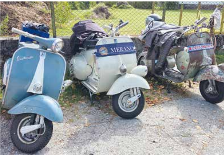
▲ Vespa Faro Basso – Bild Mitte + Rechts

pa-Herzen höherschlagen ließ. Zurück am Veranstaltungsort, war für das leibliche Wohl bestens gesorgt. Gutes Essen, erfrischende Getränke und italienische „Dosenmusik“ mit Klassikern aus den 60er, 70er und 80er Jahren.