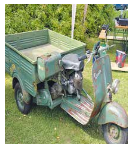
▲ Vespa Acma Triporteur 1955