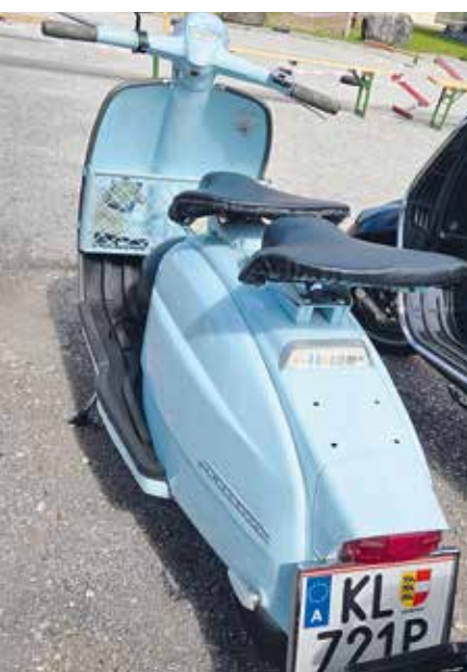
▲ Lambretta 125

Die Route führte durch das wunderschöne Rosental, über Zell-Pfarr, zum Freibacher-Stausee, über St. Margareten und schließlich zurück nach Ressnig – bei bestem Wetter und einer beeindruckenden Bergkulisse, die nicht nur Ves-