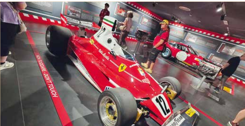
▲ Nikis Dienstwagen – Ferrari 312T