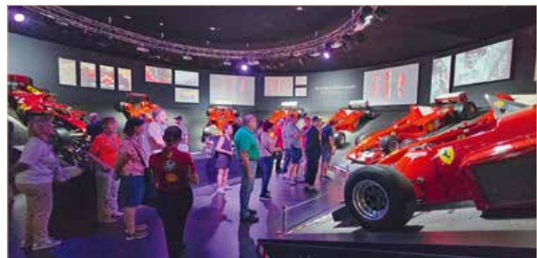
▲ Formel 1 – Siegerautos , soweit das Auge reicht

4 Tage Genuss am Unerreichbaren zu genießen dient lediglich dazu, das Auge zu erfreuen und der Seele Ruhe und Frieden zu schenken. Oh ja, man wacht dann bald wieder auf und sieht sich schnell wieder dem Alltag mit seinem