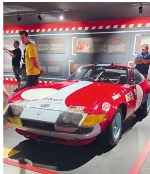
▲ Ferrari 365 GTB/4 „Daytona“