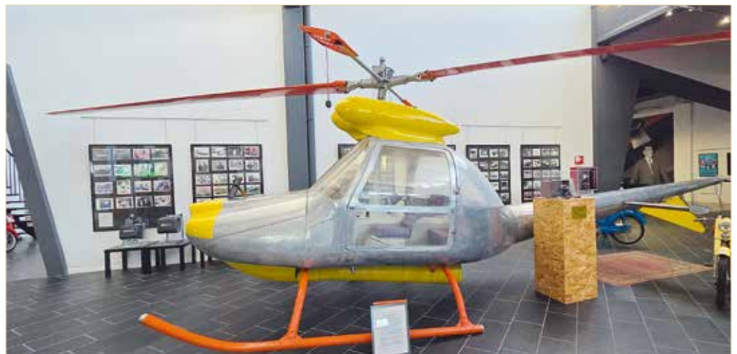
▲ Auch flugfähige Hubschrauber wurden bei Lamborghini entwickelt

Ein Reiseprogramm sollte eigentlich eine Orientierung sein und dazu dienen auch eine Wertschätzung zu erwirken. Wenn einiges davon umgestoßen oder gar ausgelassen wird