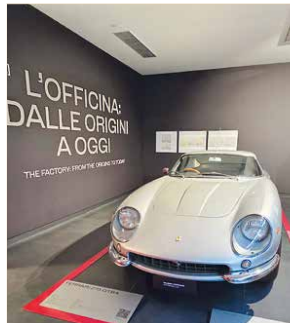
▲ Ferrari 275 GTB4 im Museo Ferrari