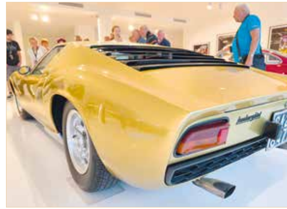
▲ Lamborghini Miura Werknummer 1 – Museo Lamborghini, Sant'Agata Bolognese