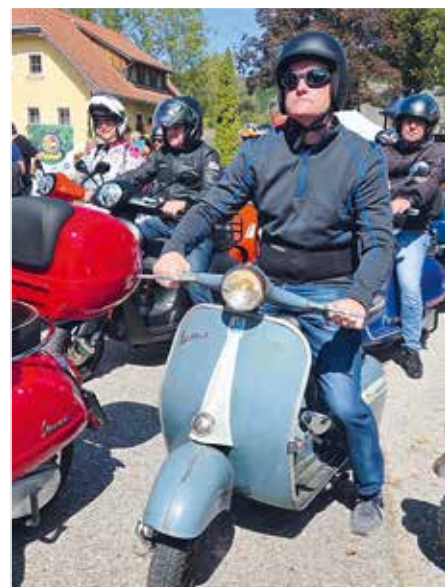
▲ Vespa 150VBB