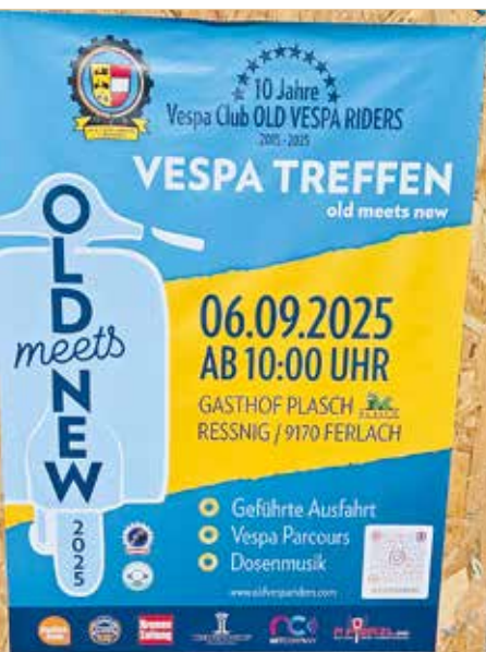
▲ Old meets New

„Auf Achse“ - KMVC – Mitglieder unterwegs