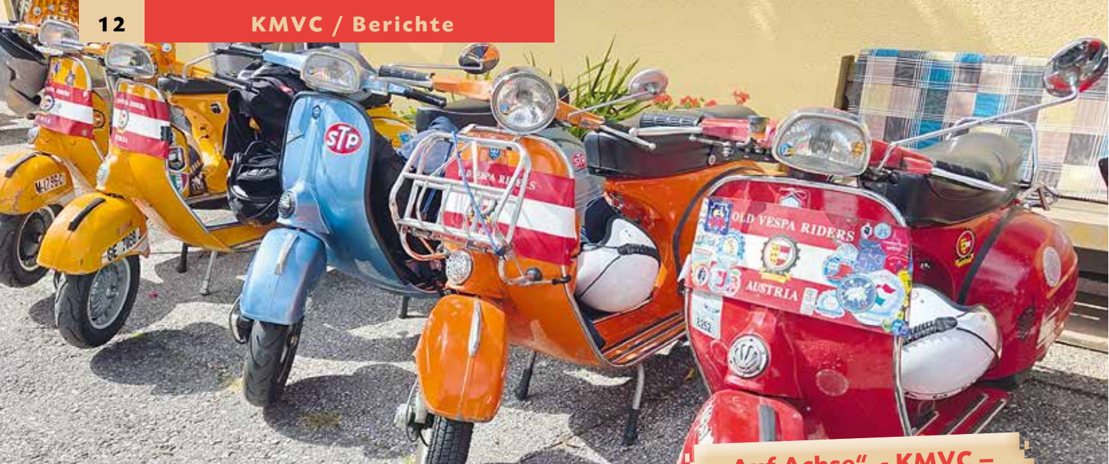
▲ Vespa Sprint, Vespa Rally 180, Spanische Motovespa 160GT Runde

„Auf Achse“ - KMVC – Mitglieder unterwegs