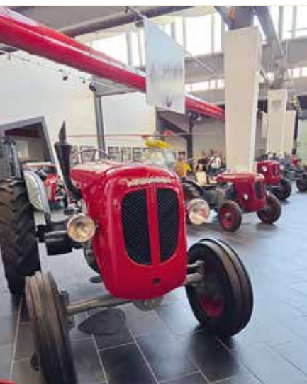
▲ Mit Traktoren machte sich Lamborghini einen Namen