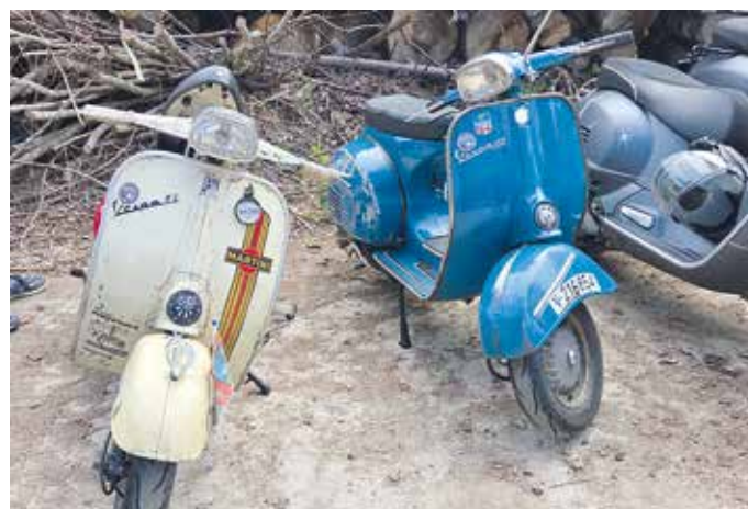
▲ Motovespa 160 Gt blau, Vespa GL weiß