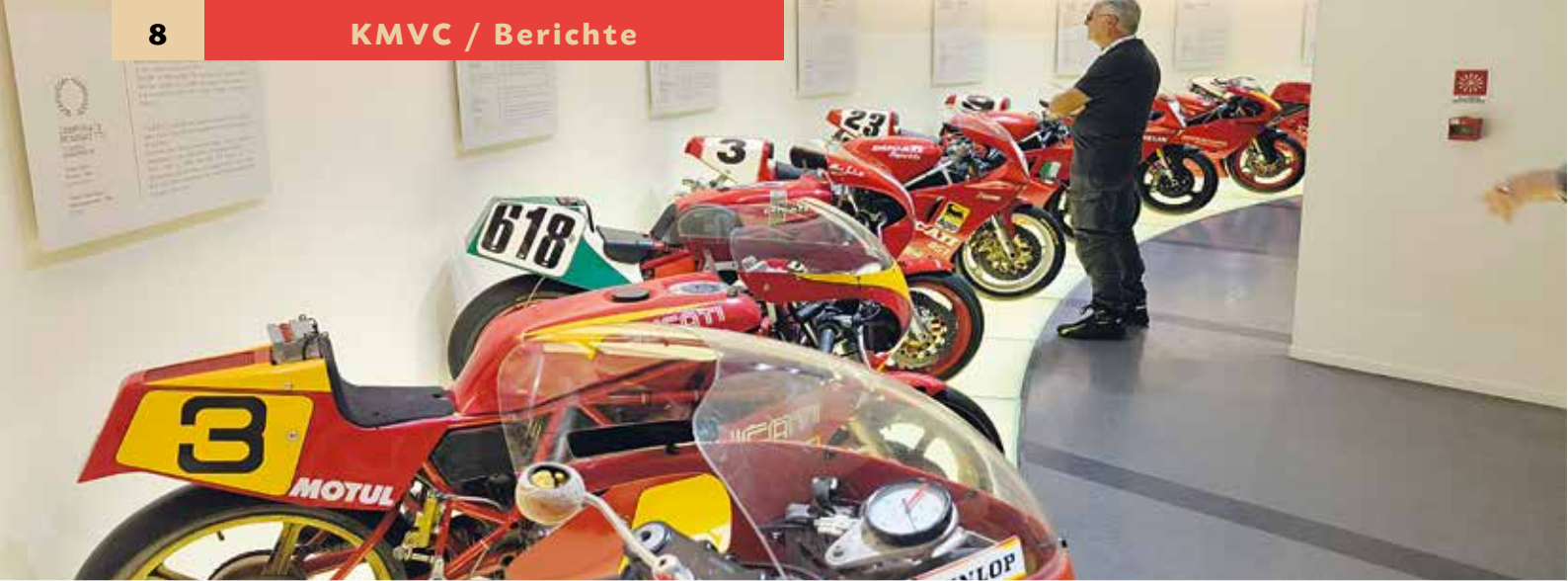
▲ Museo Ducati - Borgo Panigale Experience