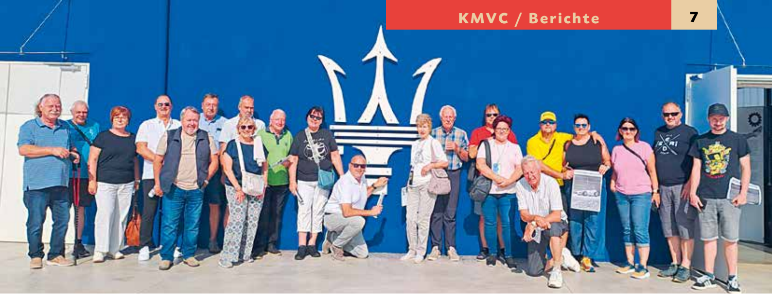
▲ Gruppenfoto - LA COLLEZIONE MASERATI - Umberto Panini