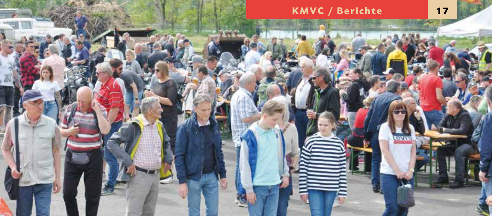
▲ ...und etwas später ....