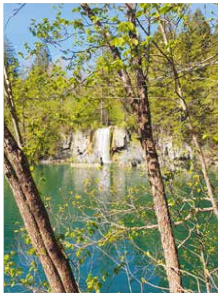
▲ Plitvicer Seen ...