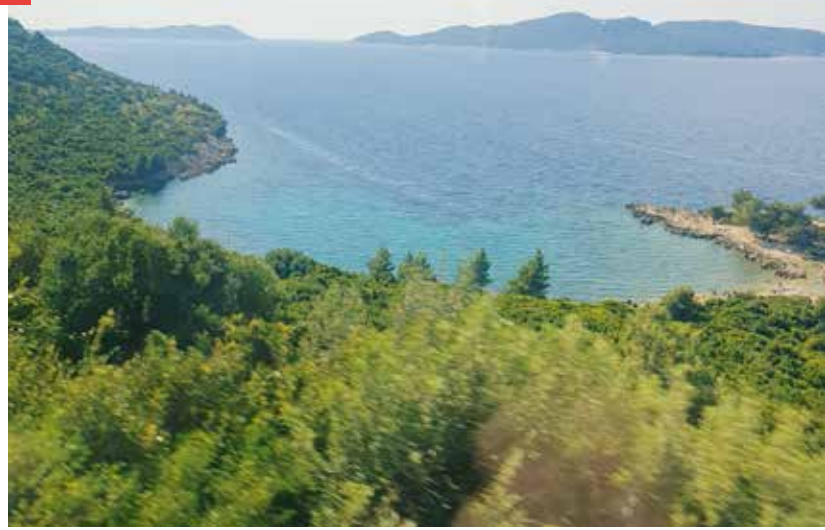
▲ Aussicht auf die Küste ...

Auf 670 m Seehöhe liegt die ehemalige Hauptstadt Montenegros CETINJE, mit heute ~14.000 Einwohnern ist sie die zweitgrößte Stadt des Landes. Wir erfahren von der schwierigen geschichtlichen Position Montenegros bis zur heutigen Unabhängigkeit, auf die die Montenegriner besonders stolz sind. In dem Bergdorf NJEGUSI machen wir Halt für eine Verkostung von heimischen Produkten. Hier befindet sich die Wiege von Fürsten und Bischöfen, wo sich auch das Mausoleum vom letzten König der Petrovic-Njegos-Dynastie im Lov en-Nationalpark auf 1657 Metern befindet. Es ist das höchste Bauwerk dieser Art auf der Welt, das auf einem der Jezerski-Gipfel des Berges Lov-en thronet.