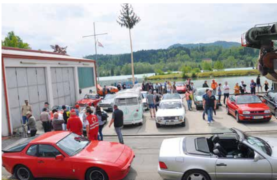
▲ Auch Dr. Bullianzki wurde gesichtet