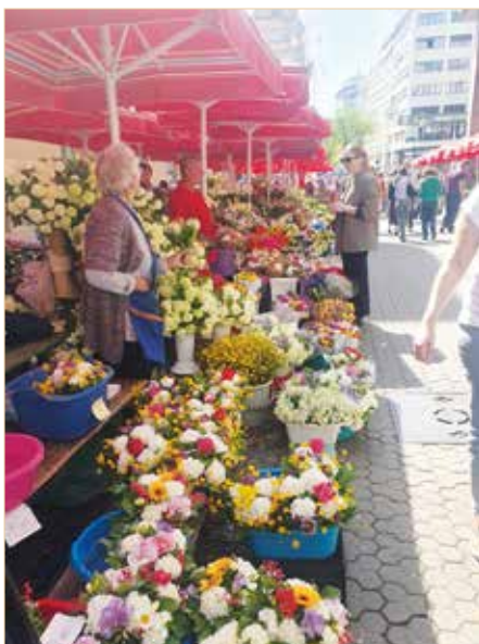
▲ Blumenmarkt in Zagreb

Am 16.04 (DI), Tag 4 , machen wir eine Busfahrt ins bergige Landesinnere.