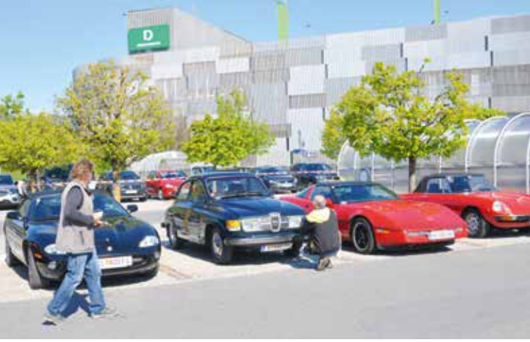
▲ Einige Oldtimer .....