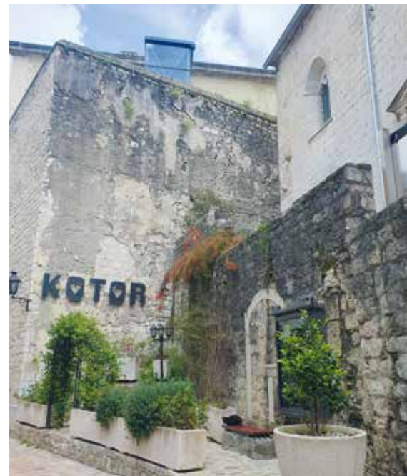
▲ Tag 6 Ausflug nach Kotor