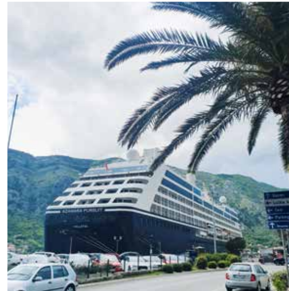
▲ Asiatisches Kreuzfahrtschiff im Hafen