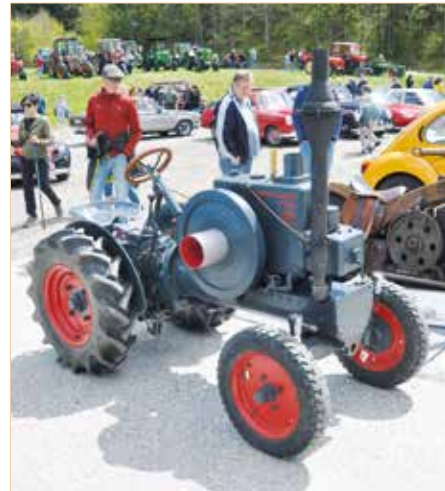
▲ Kleiner Warchalowski