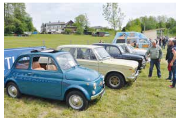
▲ Die ersten Teilnehmer sind schon da