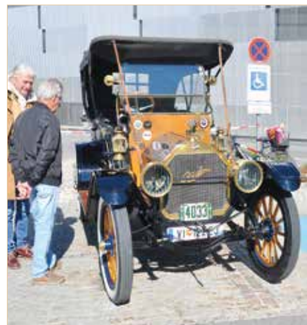
▲ Ein schöner Overland