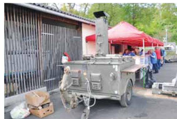
▲ Unsere bekannte Feldküche ...