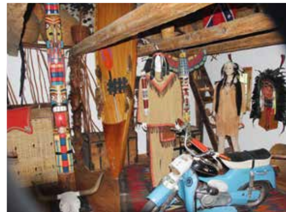
▲ Indianer am Kriegspfad reitet Puch DS-50