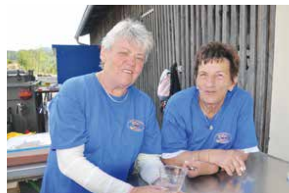
▲ ... und zwei Helferinnen-Urgesteine