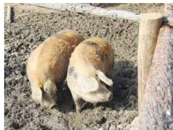
▲ Es war einfach Sch....e geil!!!