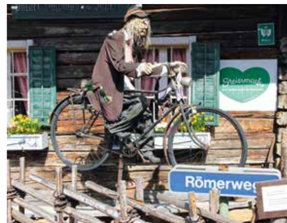
▲ „Jo mir san mißn Radl do“