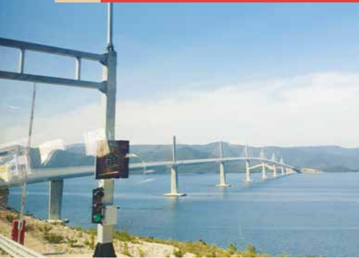
▲ Peljesac-Brücke nach Dubrovnik