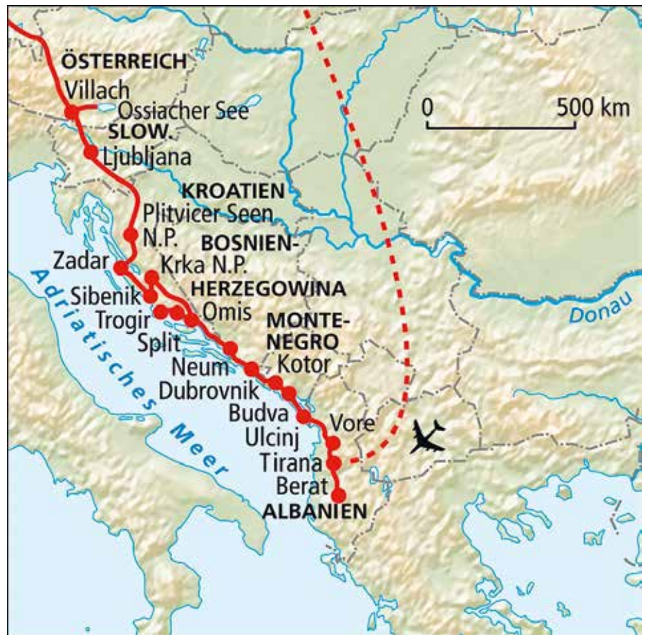
▲ Dalmatische Küste Reiseroute

Im Hof der Hard Rock Cafe gab es zur Überraschung für unsere Oldtimerfreunde