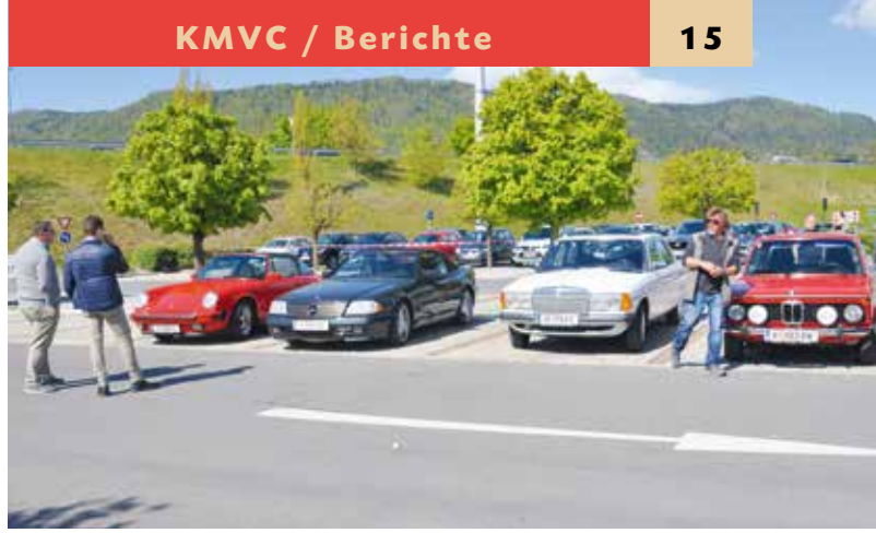
▲ ... unser Mitglieder