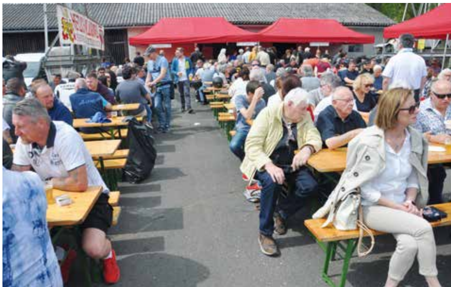
▲ ... die Sitzplätze sind gut besucht ...